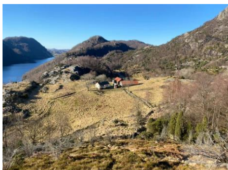
Kleppali med Ørdsalsvatnet i bakgrunnen.