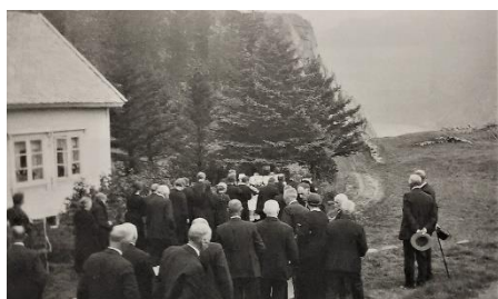
Mange var samle i heimen når båra bæres ned til kaia i Kleppali.