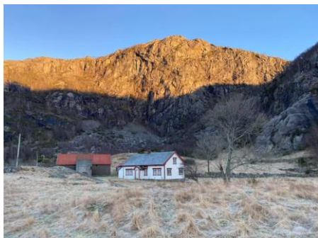
Gardshusa i Kleppali 2021.

Nye bilder legges ut fortløpende, så følg med!