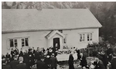
Gravferdsdagen til Villien Kleppali 1937.