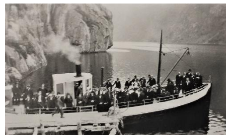
På veg til Bjerkreimskirken med gravfølget om bord på skyssbåten Ørdsdølen I.